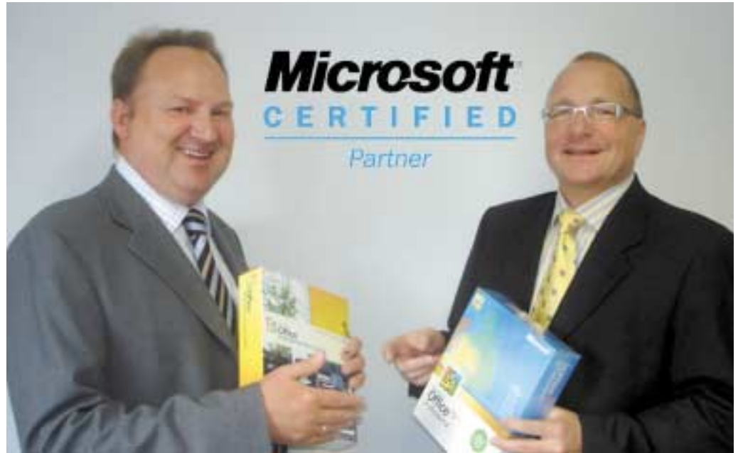
Oft liegt Software nicht als Produkt in Form eines Datenträgers vor, sondern nur als Nutzungsrecht.

Alte verkaufen, neue kaufen Gebrauchte Software ist dabei seiner Ansicht nach eine gute Möglichkeit, Löcher zu stopfen.