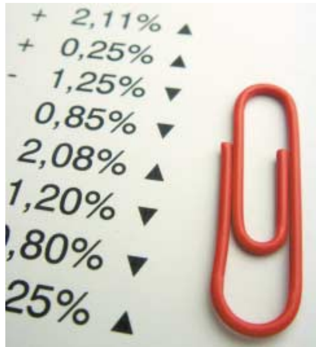
Rechnen Sie sich beim Business-Plan nicht reich!

Das Problem von Forderungsausfällen oder einer schleppenden Zahlungsmoral der Kunden sollte ebenfalls bedacht werden.