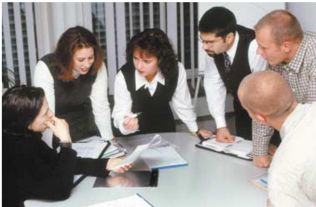
Qualität(s-Sicherung) ist die Basis für dauerhaften Erfolg.